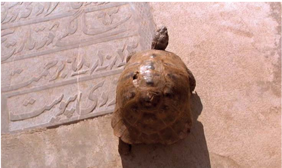
Le vent nous emportera

Propos traduits par Massoumeh Lahidji, recueillis par Marie Frering