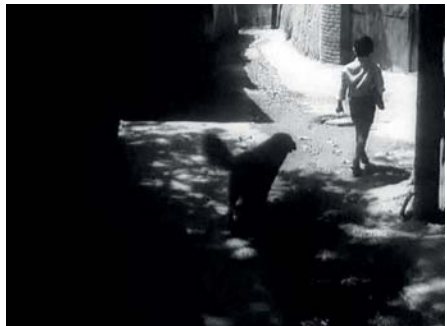
Le pain et la rue