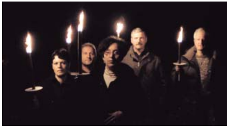
Bienvenue à Bataville

le dispositif. On se retrouve vite à court de munitions, il y a risque de redite, le film menace de se parodier. Bref, le montage de Bienvenue à Bataville a été très long, bien plus long que prévu. À un moment, le film a atteint une durée de quatre heures et j'ai dû me calmer. Enfin c'est plutôt le producteur qui m'a calmé!